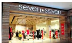
Seven Seven Jardín Plaza Cali