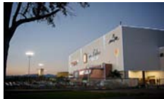
San Pedro Plaza Neiva