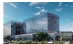
Plaza Claro Bogotá