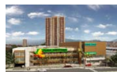
Plaza Arrayanes Itagüí