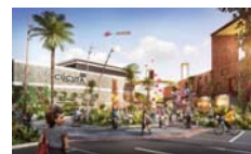
Jardín Plaza Cúcuta