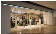
Falabella Mall Plaza Manizales