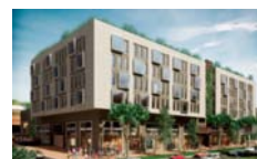
Usaquén Plaza Bogotá