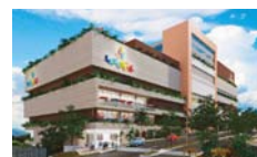
La Central Medellín