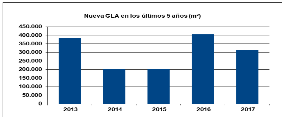
Gráfico n° 3: Nueva GLA inaugurada en los últimos 5 años