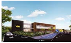
Viva Tunja Tunja