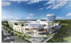
Terra Plaza Popayán