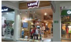
Levi's CC Unicentro Cali