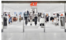
H & M CC Parque La Colina