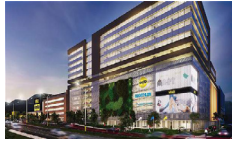
Viva Envigado Medellín