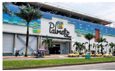
Palmetto Plaza Cali