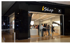
iShop CC Viva Barranquilla