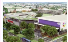
Marcas Mall (Proyecto) Cali