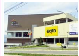
De la Cuesta Piedecuesta