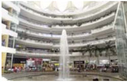
Unicentro Cali Cali