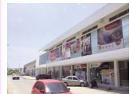
Outlet El Bosque Cartagena