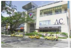
Parque Arboleda Pereira