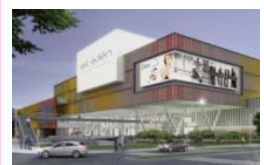
El Éden (Proyecto) Bogotá