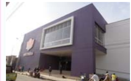
Micentro Funza Funza