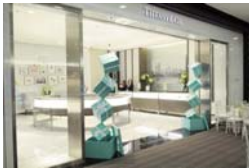
Tiffany & Co. Centro Andino