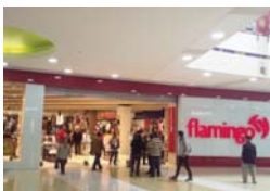
Flamingo Centro Mayor