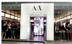
Armani Exchange Parque Caracolí