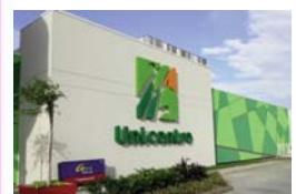
Unicentro Palmira Palmira