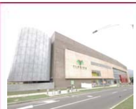
Parque Comercial Florida Medellín