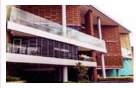
Centro Andino Bogotá