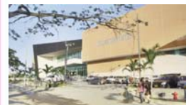
C.C. Buenavista Montería