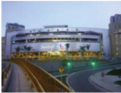
C.C. Santafé Medellín