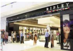
Ripley Centro Mayor, Bogotá