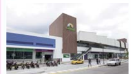
C.C. Calima Armenia Armenia