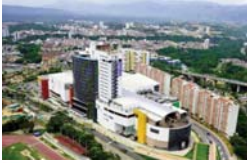
C.C. Cacique Bucaramanga